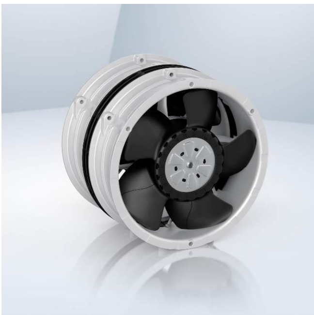
Bild 2: Beim modularen Konzept des 6300N Counter-Rotating werden zwei Standardlüfter in Reihe geschaltet.