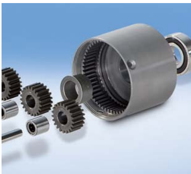
Bild 1 verstärkte Abtriebsstufe der Planetengetriebe

In Verbindung mit den drehmomentstarken und langlebigen Antrieben in energieeffizienter GreenTech EC-Technologie von ebm-papst lassen sich damit optimal angepasste Motor-Getriebe-Kombinationen für besonders hohe Lebensdauernforderungen oder dynamische Anwendungen mit erhöhten Spitzenbelastungen kombinieren. Mit Antriebsleistungen bis zu 400 W entstehen immer wieder neue Antriebslösungen für viele unterschiedliche Anwendungen z.B. in der Industriellen Automatisierung, der Intralogistik oder auch der Medizintechnik.