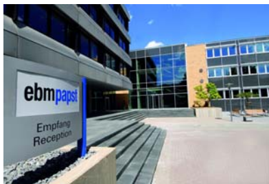
Bild 2: Produktion am Unternehmensstandort Mulfingen (Baden-Württemberg)

Bild 1: Unternehmenszentrale der ebm-papst Gruppe in Mulfingen (Baden-Württemberg)