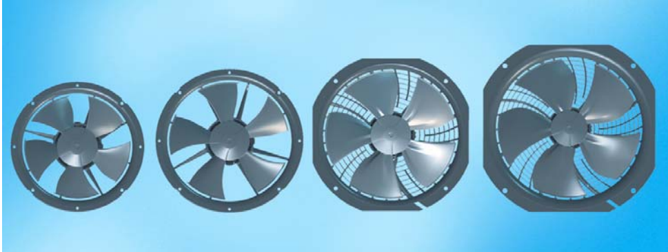
Bild 1: Energiespar-Ventilatorenbaureihe W1G200, W1G230, W1G250 und W1G300

[1] Gerät bei dem der Schutz gegen elektrischen Schlag nicht nur auf der Basisisolierung beruht, sondern bei dem eine zusätzliche Schutzmaßnahme wie doppelte oder verstärkte Isolierung vorhanden ist; es ist keine Vorrichtung zum Anschluss eines Schutzleiters nötig.