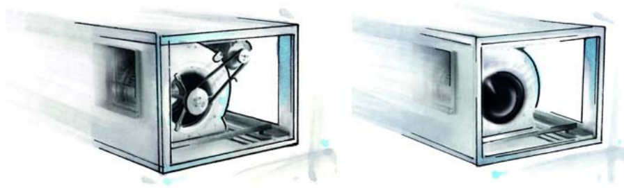
Bild 1: Ohne Änderungen am Gerätedesign ist ein Umrüsten vom konventionellen Asynchronmotor auf moderne Energiespartechnik möglich (links: herkömmliche Technik mit Riemenantrieb, rechts: neue Technik mit EC-Motor integriert)