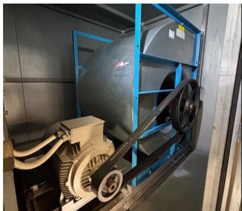
Bild 1: Im Bestand sind sie noch häufig im Einsatz: Alte, riemengetriebene AC-Ventilatoren sorgen für einen hohen Wartungsaufwand und Energieverbrauch.

NEXAIRA wurde mehrfach ausgezeichnet, etwa mit dem Wirtschaftspreis Schwarzer Löwe, und Umwelttechnikpreis Baden-Württemberg. Das digitale Ökosystem war außerdem Finalist beim Deutschen Nachhaltigkeitspreis.