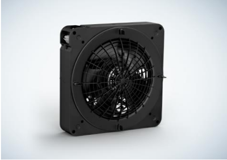
Bild 1: Neues Diagonalkompaktmodul für Schaltschrank-Filterlüfter