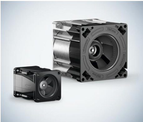
Bild 2: Neue Baugrößen verfügbar: DiaForce 40 (links) und DiaForce 80 (rechts)