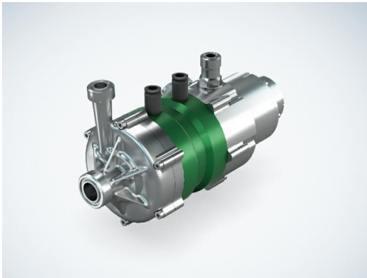
Bild 1: ebm-papst entwickelt Turboverdichter im elektrischen Leistungsbereich von 1 kWe bis ca. 55 kWe, die variable Fördermengen verschiedener Kältemittel ermöglichen und durch interne Volumenreduzierung von 90 % mit deutlich weniger Kältemittel auskommen (Beispiel Verdichter P2).