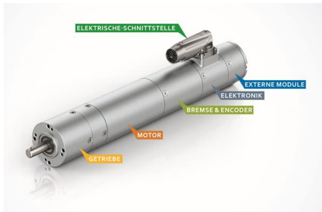
Bild 1: Modulares Antriebssystem: Alle individuell ausgewählten Antriebskomponenten sind in einem gemeinsamen Gehäuse untergebracht.