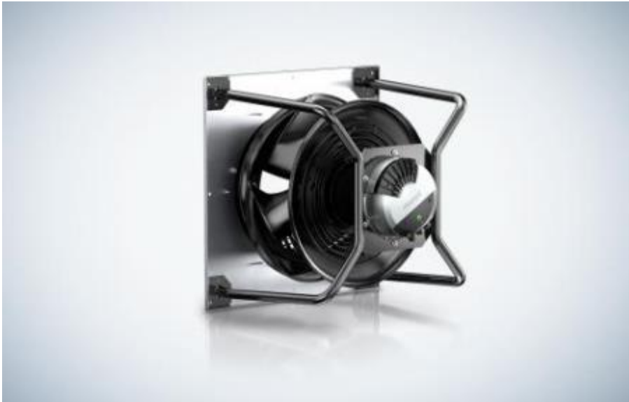
Bild 1: Der neue Radialventilator RadiPac von ebm-papst ist bestens für Retrofits geeignet.