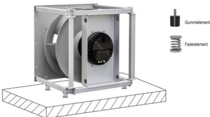
Bild 2: Um den Ventilator von Schwingungen in der Umgebung zu entkoppeln, helfen Schwingelemente, also entsprechend ausgelegte Federn oder Gummierelemente.

Bilder ebm-papst Zeichen ca. 2.600, mit Überschriften und Zwischenüberschriften Tags EC-Ventilatoren, Schwingungsmessung, Ventilatoraufbau, Schwingelemente, Schwingungssensor, Lebensdauer Link www.ebmpapst.com