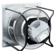
EC Radialventilatoren – RadiPac Tragspinnenkonstruktion Baugrößen 355 - 400