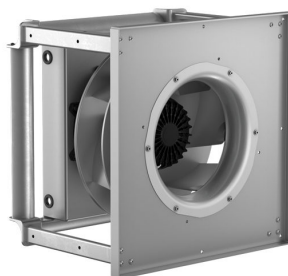
RadiPac Würfelkonstruktion Baugrößen 560 – 630