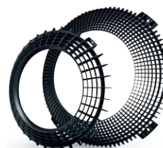
Vorleitgitter – FlowGrid Optional

Abmessungen und Anschlüsse siehe Datenblatt