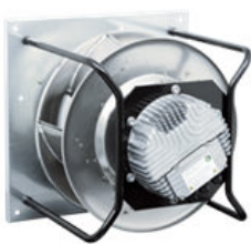
EC Radialventilatoren – RadiPac Tragspinnenkonstruktion Baugrößen 355 - 400