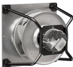
EC Radialventilatoren – RadiPac Tragspinnenkonstruktion Baugrößen 250 - 800