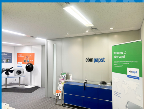
新横浜オフィスエントランス