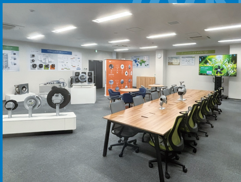
カスタマー エクスペリエンス センター @ 座間倉庫