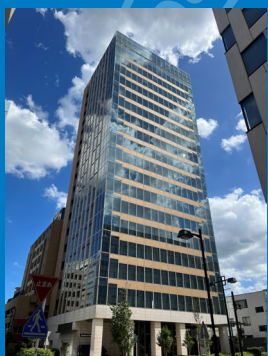
新横浜オフィスビル

物流倉庫は横浜から西へ約 20 キロ神奈川県のおぼ中央に位置する座間市にあります。東名高速道路や首都圏中央連絡自動車道など高速道路へのアクセスに便利で、効率的な全国配送サービスをご提供しています。