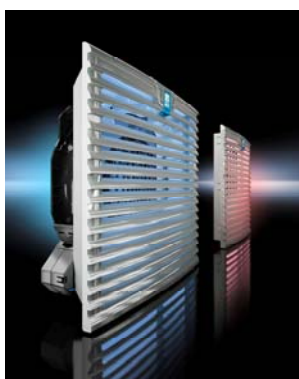
Bild 2: Die Filterlüfter, die für Luftleistungen von 20 bis 900 Kubikmeter pro Stunde zur Verfügung stehen, bauen bei ansonsten gleichen Einbaumaßen flacher als frühere Ausführungen mit Axialventilatoren, bieten jedoch eine weitaus höhere Druckstabilität