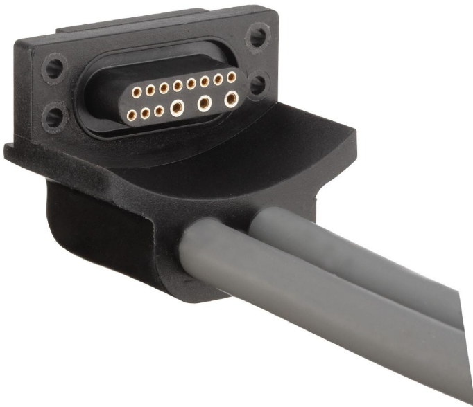
Bild 4a,b Neuentwickeltes Steckersystem mit umfangreicher Schnittstelle für maximale Funktionalität und mit sauberer Abdichtung