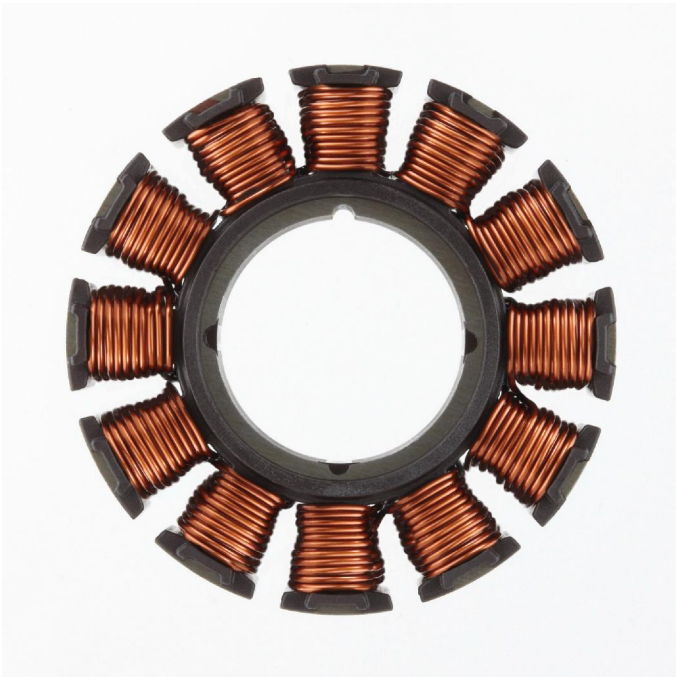
Bild 2a,b Der vielpolige Aufbau des Stators sorgt für hohe Leistungsdichte bei rationellem Fertigungskonzept