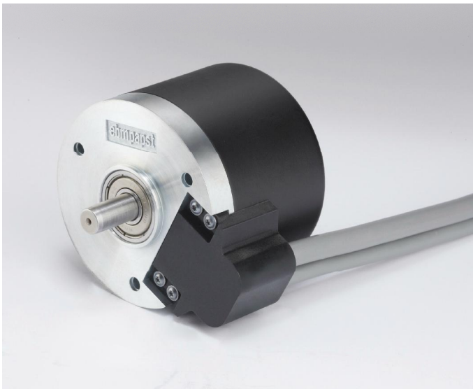
Bild 1 Kompakte Bauform, hohe Leistungsdichte und robuster mechanischer Aufbau