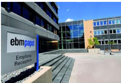
Bild 2: Produktion am Unternehmensstandort Mulfingen (Baden-Württemberg)

Bild 1: Unternehmenszentrale der ebm-papst Gruppe in Mulfingen (Baden-Württemberg)