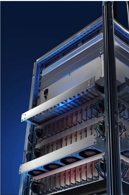
Bild 1: Vertikale Durchströmung. Mehrere Lüfter in einem Einschub