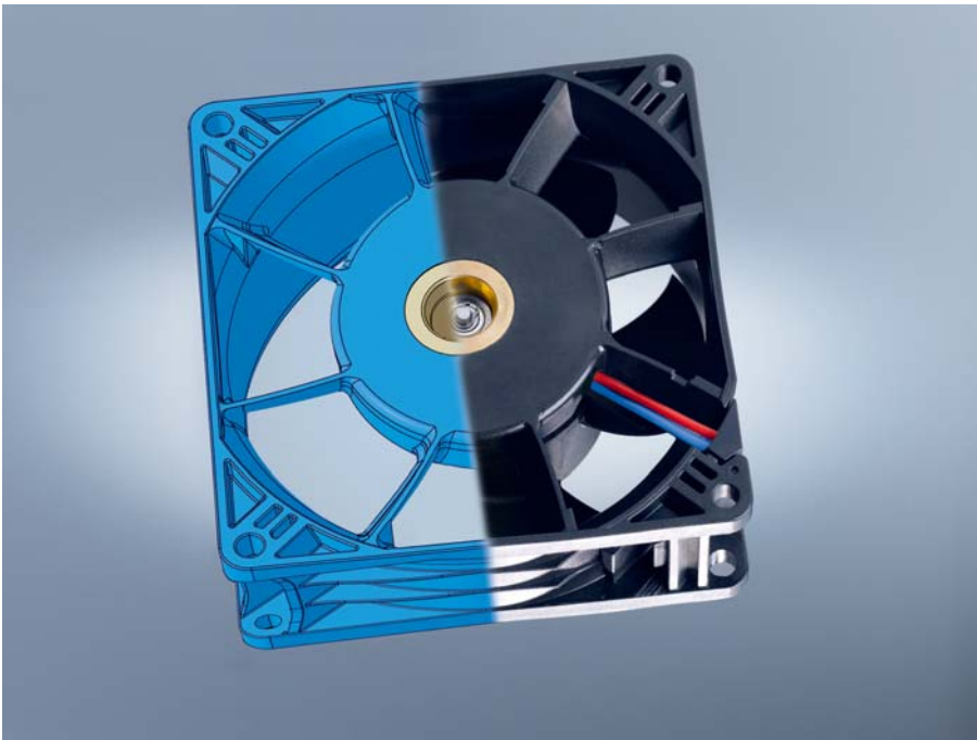
Bild 3: Gehäuse-Versteifungen an den richtigen Stellen senken die Körperschall-Anregung trotz erweitertem Drehzahlbereich