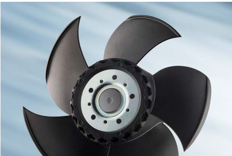
Bild 4: Winglets am Rotorblattende verbessern die Aerodynamik und das Geräuschverhalten