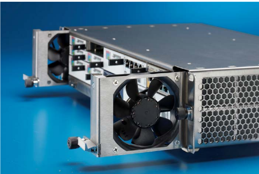
Bild 2: Lüftung horizontal. Lüfter mit vorgeschaltetem Schutzgitter